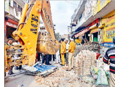
तोड़फोड़ की कार्रवाई करती निगम की टीम।

पुरानी महावीर कॉलोनी में नगर निगम की टीम व लोगों के बीच विवाद हो गया। लोगों ने मंदिर के निर्माणाधीन गेट तोड़ने का विरोध किया तो निगम की टीम को बैरंग लौटना पड़ा। हुआ यूं कि लक्ष्मीनारायण बालाजी मंदिर का निर्माणाधीन गेट तोड़ने पहुंची नगर निगम की टीम का मंदिर प्रबंधन कमेटी व आसपास के लोगों ने विरोध किया। निगम की टीम ने बुलडोजर से निर्माणाधीन गेट हटाना शुरू किया तो लोगों ने एकत्रित होकर नारेबाजी शुरू कर दी। लोगों का आरोप था कि लोगों की आस्था के साथ खिलवाड़ किया जा रहा है। नगर निगम से मंजूरी लेकर मंदिर का गेट बनवाया जा रहा है। निगम की टीम की ओर से गेट को गिराने की