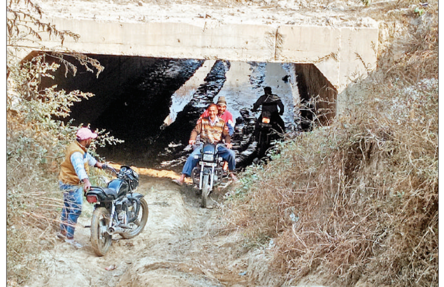
गन्जौर। अगवानपुर फाटक अंडरपास में रास्ता निर्माण न होने पर जान जोखिम में डालकर निकलते दोपहिया चालक।

व कीचड़ से निकलने को विवश है। कई बार हादसे भी हो चुके हैं। लोग सरकार को कोसते हैं। वाहन चालकों का कहना कि फाटक के पास फलाई ओवर निर्माण के लिए वेनो तरफ आवागमन का रास्ता बनाने के लिए जोरो पर काम चला दिया है लेकिन फलाई ओवर के लिए जो निर्माण रेलवे की तरफ से