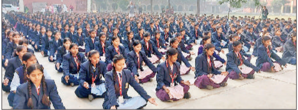
सोनीपत। कार्यक्रम के दौरान उपस्थित छात्राएं।